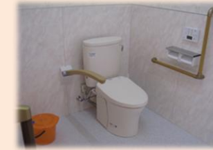
広いトイレスペース