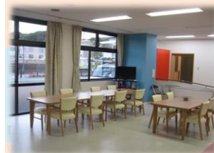
食事・談話コーナー