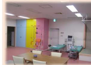
滑車訓練 低周波治療機