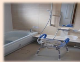
お一人ずつの入浴