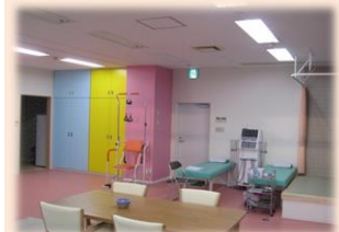
滑車訓練 低周波治療機