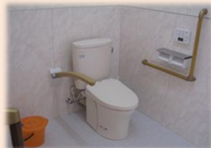
広いトイレスペース