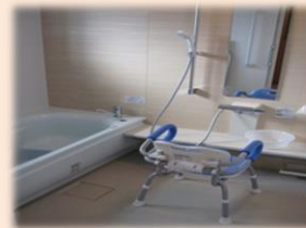
お一人ずつの入浴