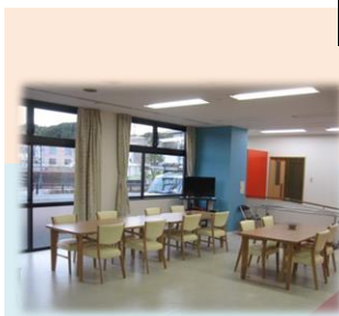
食事・談話コーナー