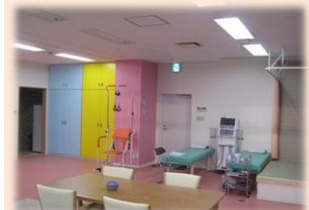
滑車訓練 低周波治療機