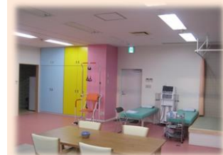
滑車訓練 低周波治療機