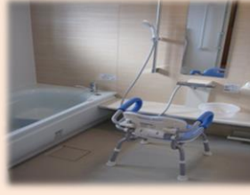
お一人ずつの入浴