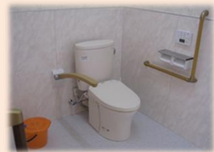
広いトイレスペース