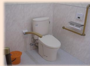
広いトイレスペース