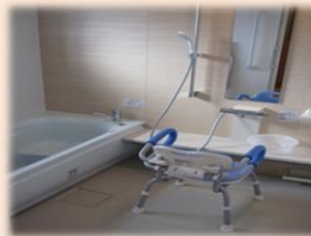
お一人ずつの入浴