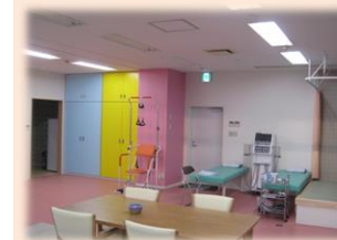
滑車訓練 低周波治療機