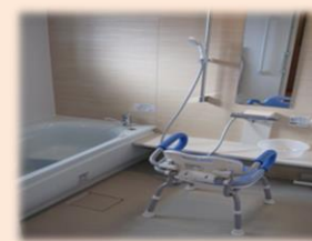
お一人ずつの入浴